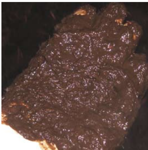
Dunne donkere mest is een teken van OEB-overschot